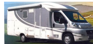
Illusion – NEU 2012