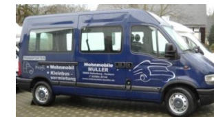
Transporter – NEU 2012